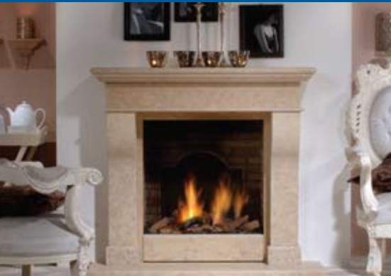
Faber Hestia Nostalgic