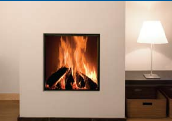
Kalfire Heat Pure