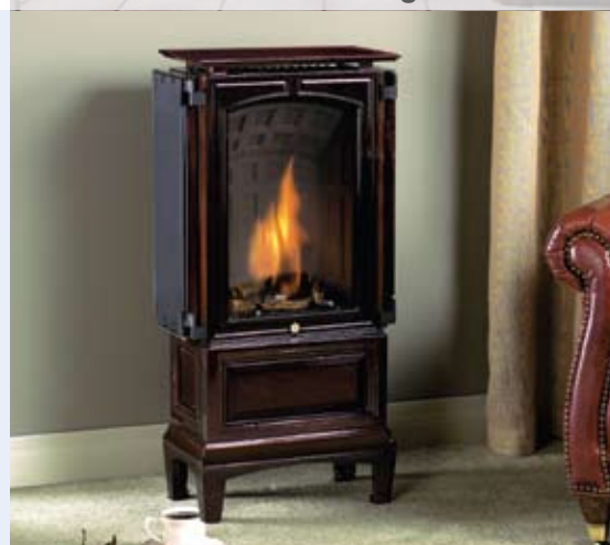
Kalfire Hergom Tudor

Unieke haard, welke zowel vrijhangend als vast opgesteld kan worden. Op de foto is de Bora Flex afgebeeld, hangend aan vier stalen draden. De Bora Fixed is aan een vaste pijp geplaatst. De haarden zijn ook draaibaar leverbaar.