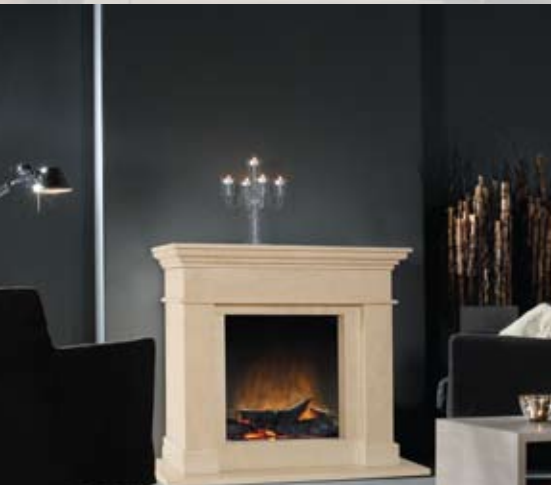
Faber Rana elektrische haard

Grijs-metallic 'wide-screen' haard met 'heated glass' en keuze uit 3 verschillende kleuren frames: zwart, grijs-metallic en hoogglans wit. Bediening met een afstandsbediening.