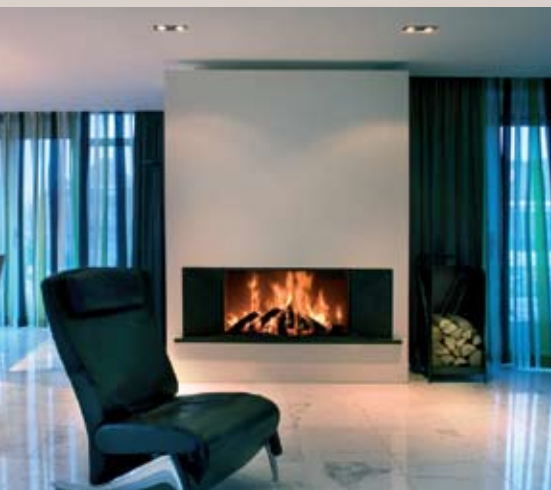
Kalfire Heat Pure Landscape

Beauty & Brains tegelijk, De Heat Pure, minimalisme in optima forma, een liftdeurhaard met maar 10 mm kader en van de onderzijde puur glas. Achter deze beauty gaan een aantal unieke gepatenteerde technieken schuil waar jarenlange ervaring en research in zit. Mede hierdoor zijn deze haarden uiterst geschikt voor de hedendaagse gebouwde woningen.