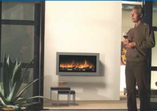
Faber SP5 elektrische haard