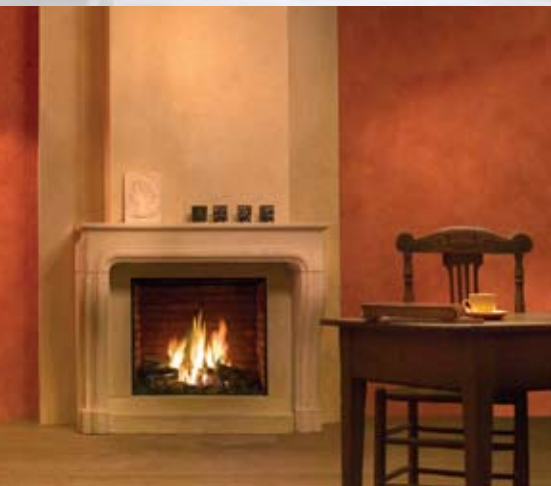
Kalfire Fura Twin Pure

Frameless haard met steenmotief achterwand en nostalgische haardplaat. Geen lijst, waardoor het de uitrusting heeft van een open haard. De schouw Jellum is leverbaar in meerdere steensoorten. De Hestia Nostalgic is uitgerust met Log Burner of Flat Burner techniek. Het bedieningspaneel aan de voorzijde is verborgen achter een uitschuifbare dorpel.