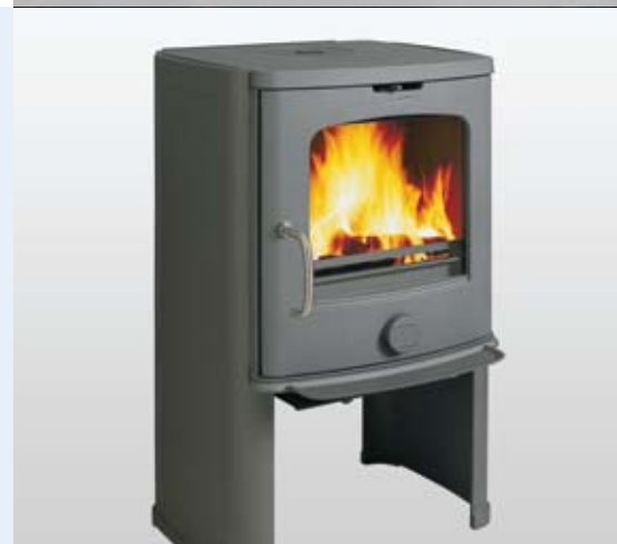
Scan Andersen 4-5