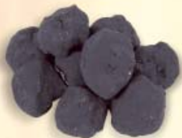
Gloeikolen 9 sts ø 6 cm.