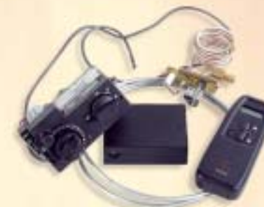
Gasregeling HB/AB afstandsbediening