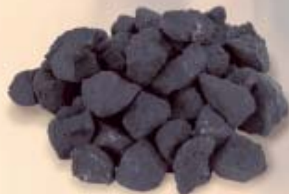
Gloeikolen klein ø 2 cm.