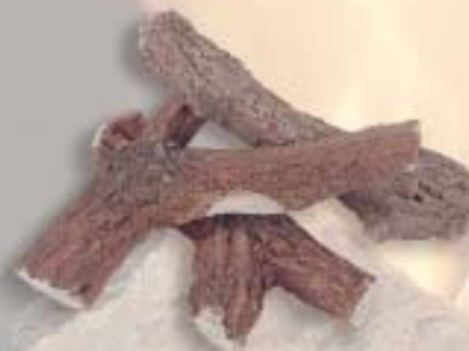
Stammenset standaard 3 sts.