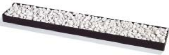
Branderbed exclusief 9015 • 90 x 15 cm. • Voor een haard met vuurbreedte vanaf 100 cm. • Zijaansluiting.