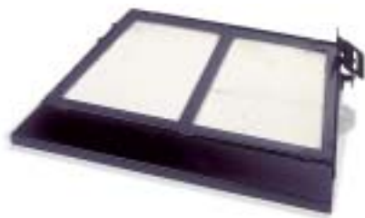
Branderbed 4525 • 45 x 25 cm. • Voor een haard met vuurbreedte van 65 tot 80 cm. • Zij- of achteraansluiting.