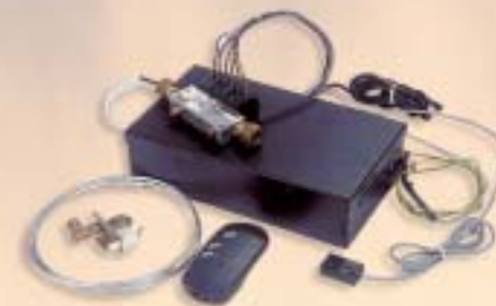
Gasregeling AB afstandsbediening

Gasregeling AB afstandsbediening: Voor maximaal bedieningsgemak is de volledig automatische gasregeling type AB ontwikkeld. Met behulp van de infrarood afstandsbediening ontsteekt en regelt u het vuur met het grootste gemak. Alle benodigde apparatuur kan onzichtbaar weggewerkt worden (alleen een ontvangeroog blijft zichtbaar). Ook dit model is voorzien van kinderslotbeveiliging. Het allermooiste is dat u er