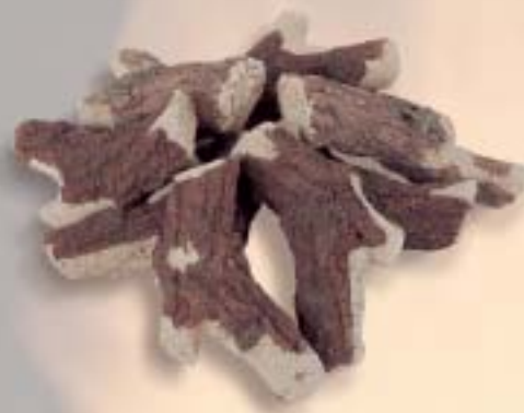
Stammenset standaard 8 sts.

U kunt het levendige gasblokken- vuur van de Topper perfectioneren met een fraai vormgegeven set kloofhout- blokken of houtstammen. Met deze keramische sfeerstukken overtreft u de realiteit van een echt houtvuur.