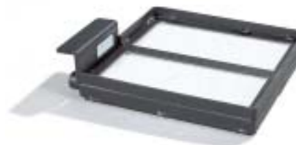
Branderbed 2424 • 24 x 24 cm. • Is o.a. geschikt voor een eilandhaard. • Onder- of zijaansluiting.