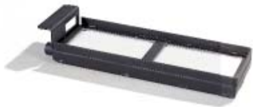
Branderbed 3613 • 36 x 13 cm. • Voor een haard met een vuurbreedte van 45 tot 65 cm. • Onder- of zijaansluiting.