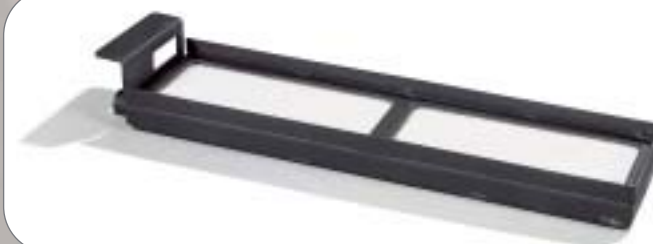
Branderbed 4813 • 48 x 13 cm. • Voor een haard met een vuurbreedte van 65 tot 80 cm. • Onder- of zijaansluiting.