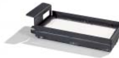
Branderbed 2413 • 24 x 13 cm. • Voor een haard met een vuurbreedte tot 45 cm. • Onder- of zijaansluiting.

Uw keurmerk: Gastec, het nationale gascentrum, heeft het Topper Gasblok volledig goedgekeurd volgens CE-normen.