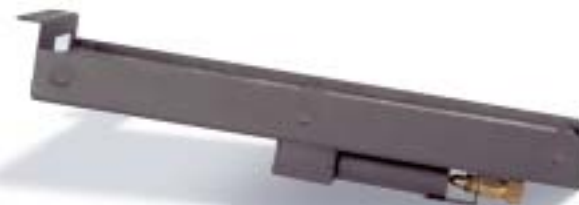
Branderbed Propaan / Butaan.