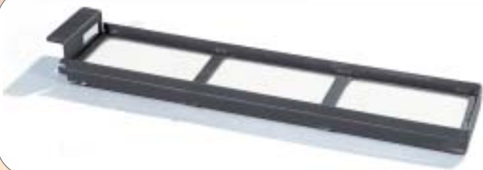
Branderbed 6013 • 60 x 13 cm. • Voor een extra grote vuurbreedte vanaf 80 cm. • Onder- of zijaansluiting.