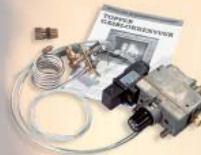
Gasregeling HB handbediening