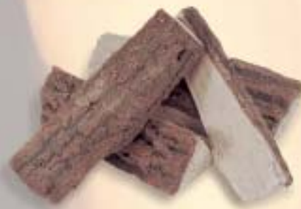
Stammenset deLuxe 4 sts.